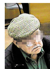
Dieses Bild aus der Überwachungskamera zeigt den tatverdächtigen Bankräuber.

GRAZ (SN-bes). Seelenruhig überfiel am Montag ein 64-jähriger Pensionist eine Bank in Graz. „Der Mann hat sich brav in der Wartereihe angestellt“, berichtete ein Polizist. Dann habe er eine Pistole gezückt und